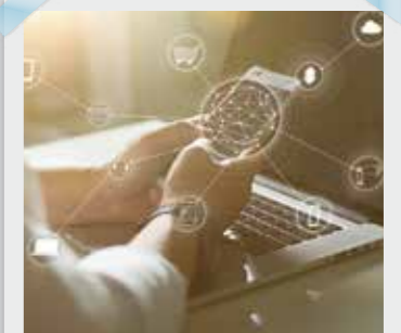
CUT6 サービス紹介映像