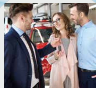
CUT4 ブランディング映像