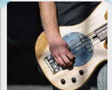
CUT3 ミュージックビデオ